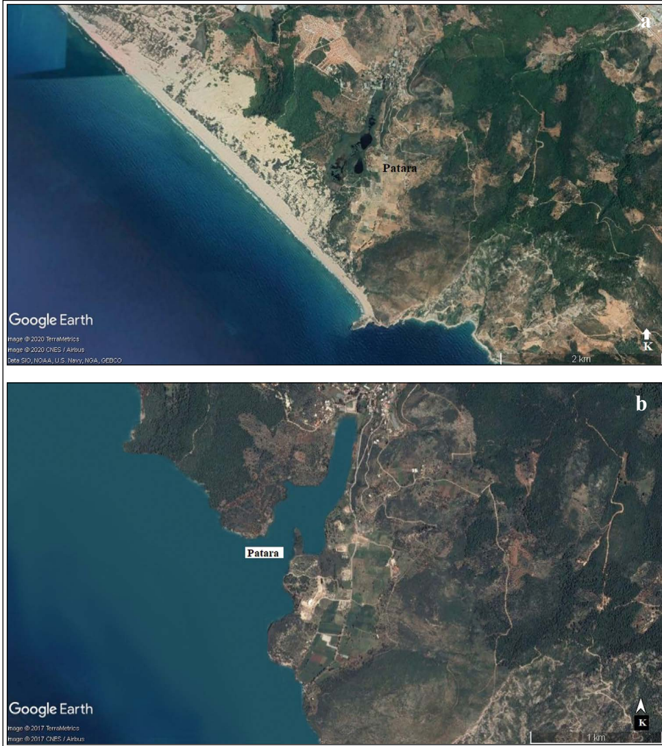
Şekil 2- a) Günümüzdeki Patara kıyı çizgisi, b) antik çağlardaki tahmini Patara kıyı çizgisi (Google Earth, 2017 haritası tabanlı).