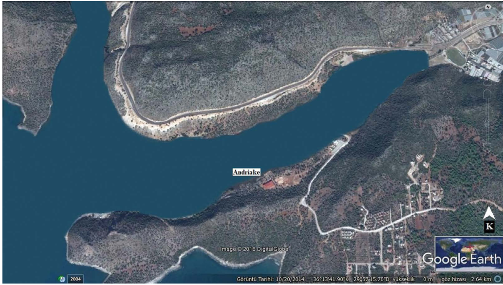
Şekil 8- Antik çağlarda tahmini Andriake kıyı çizgisi (Google Earth 2017 haritası tabanlı).

Bölgenin jeolojik temeli kireçtaşlarından oluşmaktadır. Bu nedenle, çökelleri Andriake limanına taşıyacak nehir bulunmamaktadır. Demre Çayı'nın denize ulaşan tortullarının, buradan kıyı akıntıları tarafından limana taşındığı varsayılmaktadır (Öner, 1998).