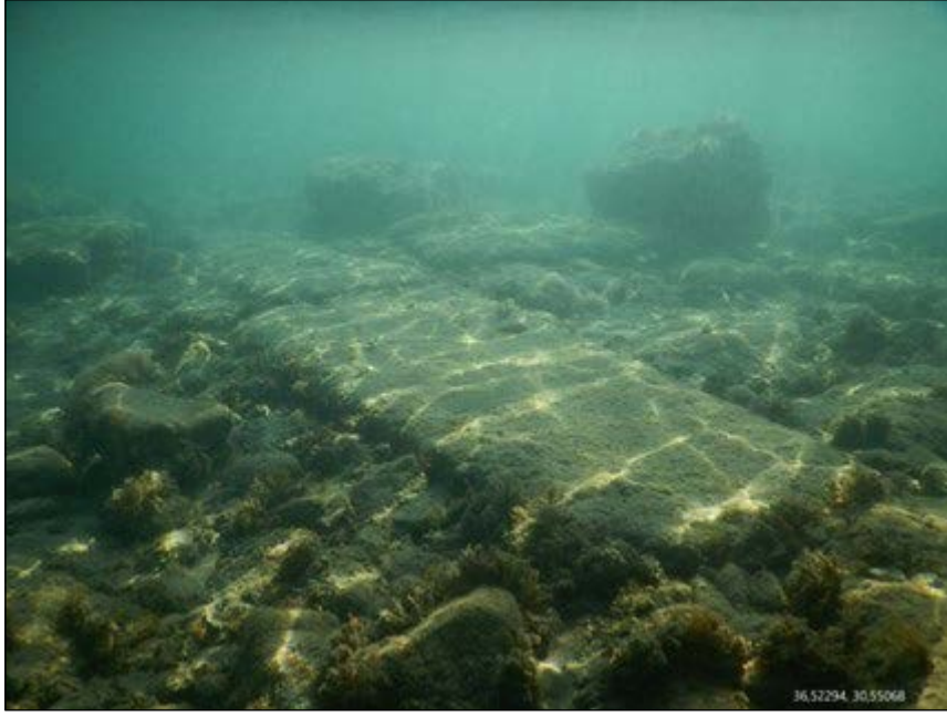
Şekil 6- Phaselis'te su altında bulunan yapı kalıntıları.

kıyılarında gözlenen, su altında bulunan çatlaklar şekil 7'de görülmektedir. Phaselis kıyısında görülen bu çatlaklara hangi depremlerin yol açtığı bilinmemektedir. Daha fazla bilgiye sahip olmak için bölgede detaylı paleosismolojik araştırmaların yapılması gerekmektedir.