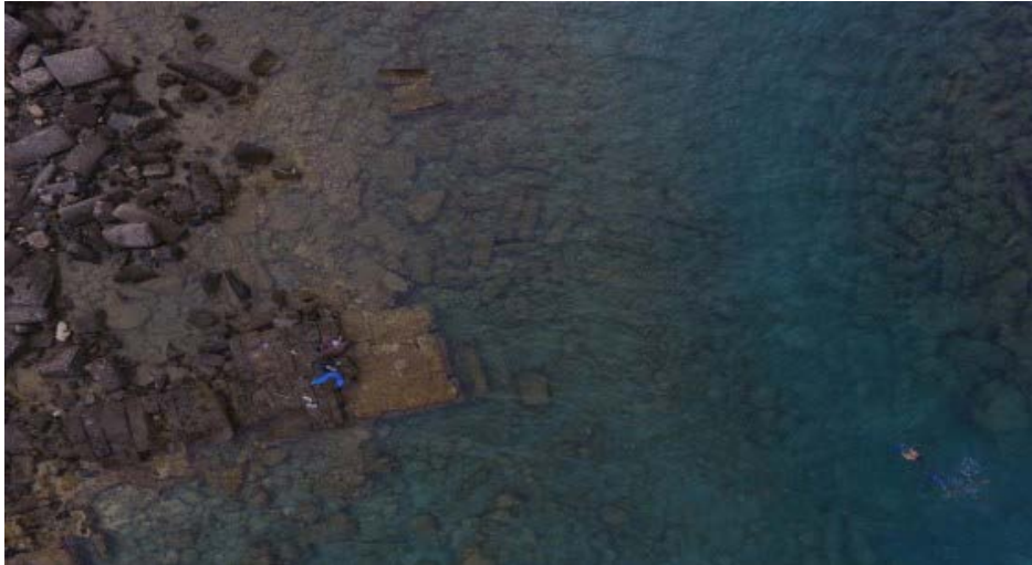
Şekil 5- Antik Phaselis Mendireği'nin hava fotoğrafı (17.07.2016).