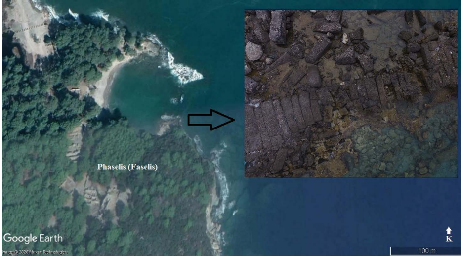
Şekil 4- Antik Phaselis Mendireği'nin konumu.