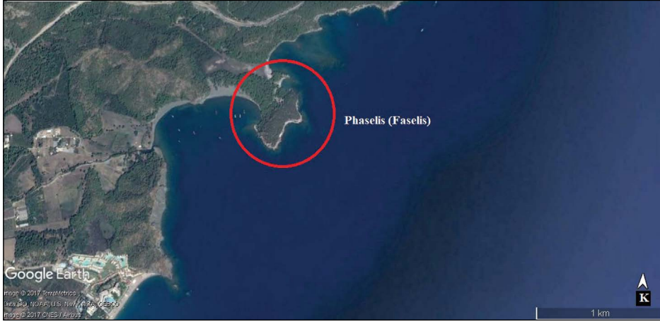
Şekil 3- Phaselis (günümüz) (Google Earth 2017 haritası tabanlı).