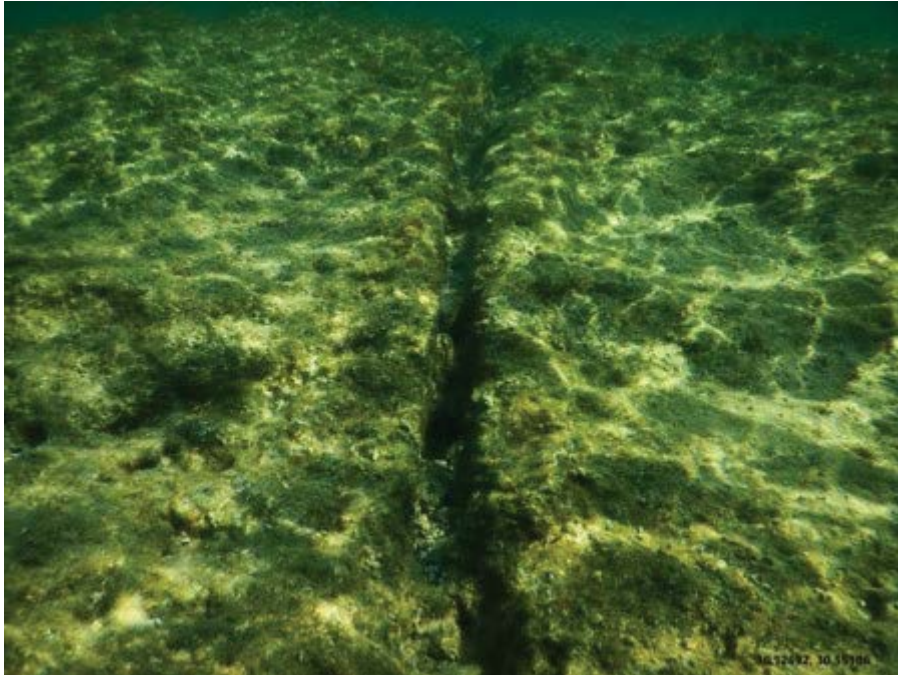
Şekil 7- Phaselis'te su altında gözlemlenen çatlak.

Andriake, Myra'nın 4,7 km güneybatısında yer almaktadır. Kent, Kumdağ Tepe ve Bozdağ Tepe arasına kurulmuştur. Günümüzden 3000-2000 yıl önce Myros Çayı'nın getirdiği alüvyonlar, Myra