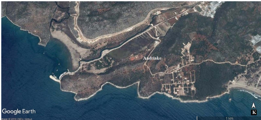
Şekil 9- Günümüzdeki Andriake kıyı çizgisi (Google Earth 2017 haritası tabanlı).