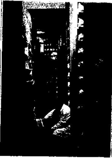
Numunelerin muhafaza edildiği karot anbarından bir görünüş.