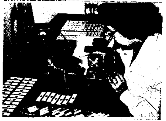
Yıkanmış numunelerin mikroskopla tetkikleri.