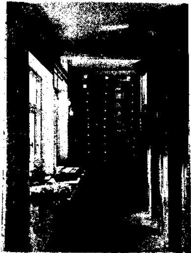
Karot anbarından diğeri bir görünüş.