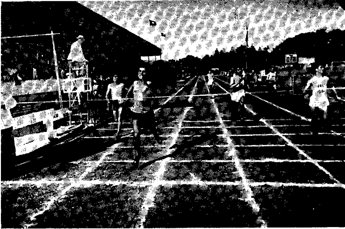
Spor alanı: Öğrenciler koşarken

1944 senesi atletizm müsabakalarında Teknisyen Okulu, sahaya kuvvetli bir kadro ile çıkararak okulda sporun şahsa münhasır bir kabiliyet eseri olmadığını, her öğrencinin aynı ciddi önemle spora çalıştırıldığını göstermiştir.