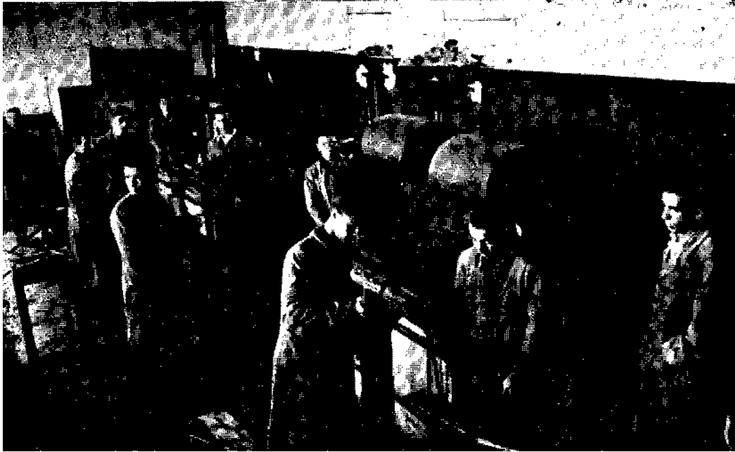
At ölye ça ışmaları

Yurdumuzun sanayi şehri Zonkuldakta bulunan Maden Teknisyen okulu henüz pek geç yaşında bulunmasına rağmen, çok hummalı bir çalışma ile memlekete teknik elemanlar yetiştirmekte olduğu kadar genç