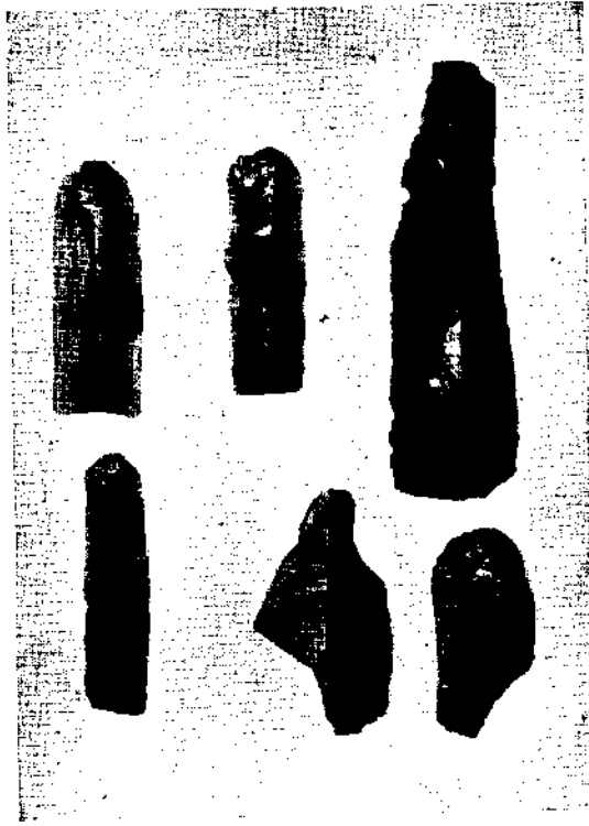
No. 3 Ilicapınar yaylasında keşfolunan siyah akik (obsidienne) taşlarından mamul bıçaklar (tabii ebadda).

Obsidianmesser von Ilicapınar yaylası; na- türliche Grösse (Photo Dr. Schröder).