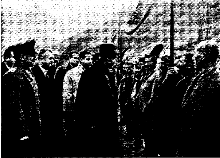
Reisicumhur İsmet İnönü Divrik ameleleri ile konuşurlarken