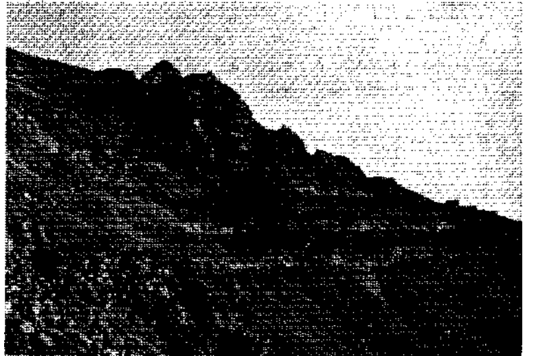
Demirdağda cevher tıraçalar şeklinde yükselirken