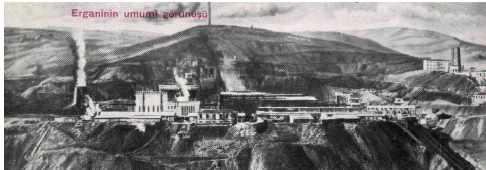
Erganinin umumi görünüşü

Türkiye maden istihsalâtında yeni olarak yer olan madenlerimizden biri de demir cevheridir. 20,360 ton gibi şimdilik büyük bir yükün arz etmiyen miktar gelecek senelerde memleket demir sanayiini karşılayacak kadar yükseleceği ve hattâ ihracat imkânları derpis edileceği şüpheşizdir,