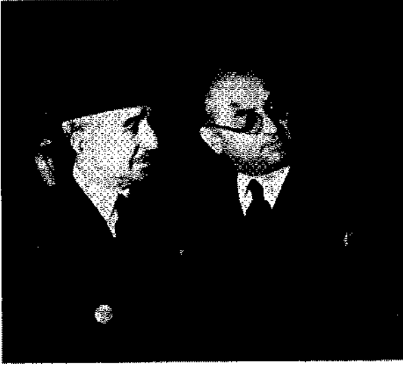
İsmet İnönü kömür sergisinde Celâl Bayar'la beraber

B - 7 A kategorisinde bahsedilen müstahzarların istihsalini temin eden tesisat ve bu tesisatın verimini arttıran ve kolaylaştıran vasıtalar