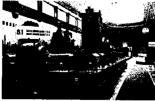
Sergi standlarından biri

Linyit kömürü de Türkiye'nin her tarafında mebzulen vardır. Maden Tetkik ve Arama Enstitüsünün çalışmalarıyla mühim