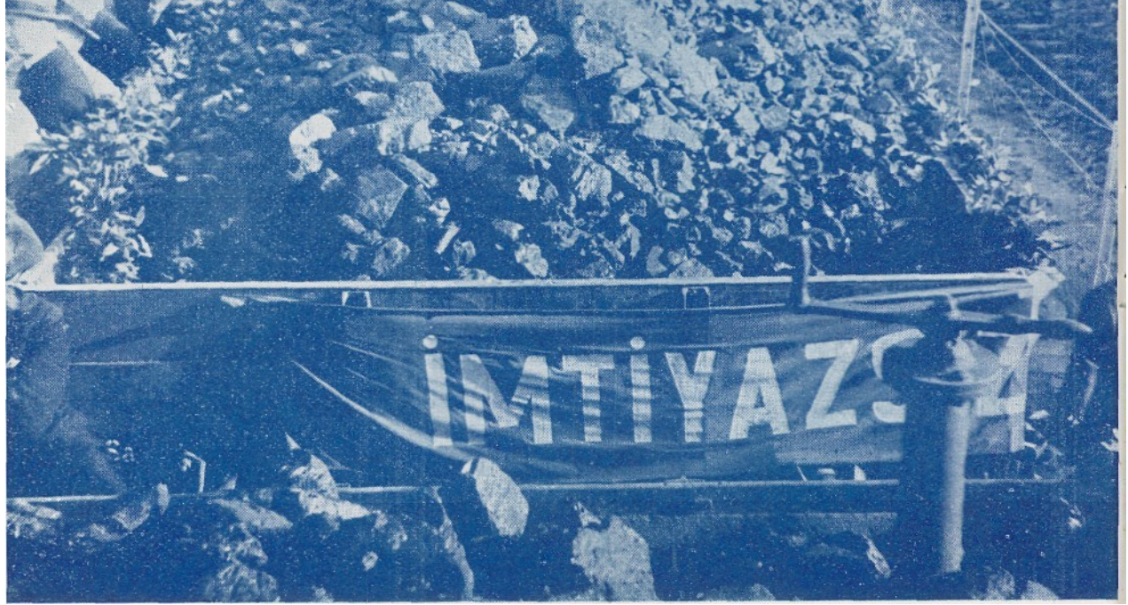
Zonguldak kömürü, Ankara istasyonunda

Bütün bu basit ve sade fakat çok faydalı ve lüzumlu yenilikler, işçinin bir çok bakımdan beyhude olan ve çalışma hevesini söndüren zahmetlerini azaltmış, ona kolaylık ve rahatlık temin etmiş oluyor. Dar görüşlü ve tek cepeli değil, hem müesseseyi, hem işçiyi kollayan, hem hali hem istikbali koruyan ve teknik cephede, yeni rejim ve zihniyetin tatbikatını teşkil eden bir metot.